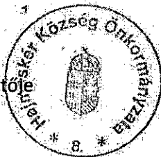
Köbli Miklós polgármester a konzorcium vezetője