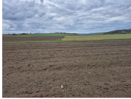
12-13. kép: Az 5. kutatási terület É-ről D felé és D-ről É felé fotózva

A 6. kutatási terület a Séd-partja és a vasútállomás területe, amely a Séd bal partján található, ahol murvás út, megművelt kiskertek és épületek találhatóak, így részben volt kutatható. Régészeti leletet, jelenséget nem találtam.