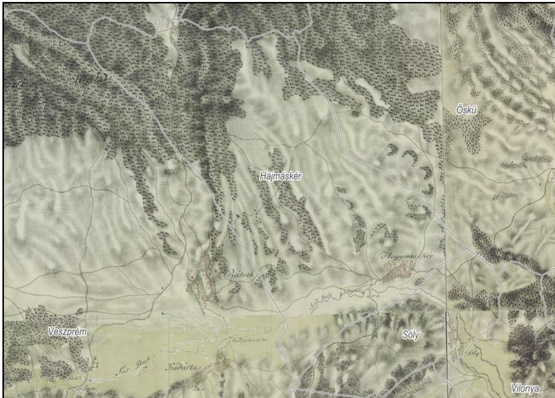
2. kép: „Hagymás Kér”, azaz Hajmáskér az I. katonai felmérés térképszelvényein

Az 1783-ban készült I. katonai felmérés alapján, a település helyzetéről mindössze annyit tudunk meg, hogy a Seed Bachtól északra fekszik (2. kép). Egyetlen jelentős épülete középkori temploma. Bél Mátyás Veszprém vármegye leírásában ez alábbiakat olvashatjuk (1735): „Hagymás kér. A veszprémi püspök faluja. Szintén köves, kavicsos és kemény talajú helyen fekszik, a Sét patak mellett, a veszprém-székesfehérvári királyi út mentén. Körülveszik téli napkelte felől Óskü, nyári napkelte felől Bala pusztá, délről Soly és Szent István, nyugatról Kadarta és Rátot, észak felől Olaszfalu és a Násadiak Pere pusztája, amelyet a lakosok saját területük fogyatkozása miatt évi pénzösszegért bérelnek. Ha ugyanis ehhez és más távolabbi pusztákhoz földművelés kedvéért nem folyamodnának, a helységben nem tudnának megélni. Nekik is megengedték vallásuknak, melyet követnek, tudniillik a reformátusnak gyakorlását.” (Bél Mátyás: Veszprém megye leírása – A Veszprém Megyei Levéltár Kiadványai 6. Veszprém, 1989).