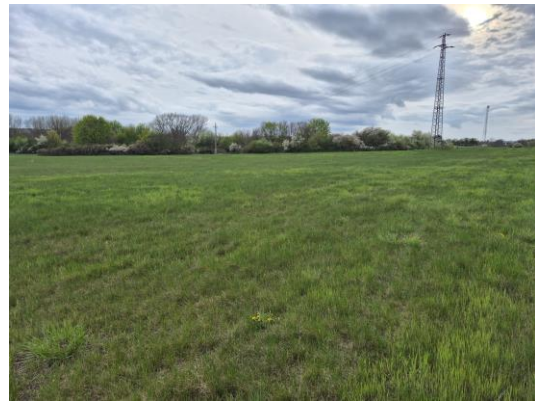
27-28. kép: A 12. kutatási terület DK-ről ÉNy felé és ÉK-ről DNy felé fotózva

A 13. számú terület a Berek-alja II. területe, amely egy elzárt, katonai, magasan fekvő, gyepes platóból (déli rész) és egy mélyebben fekvő, a Séd-patak két partján lévő, sűrűn benőtt ártéri erdőből (északi rész) áll. Ezek a területek terepbejárással nem voltak kutathatók.