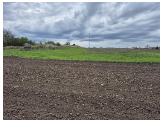
23-24. kép: A 11. kutatási terület É-ről DK felé és DK-ről ÉNy felé fotózva