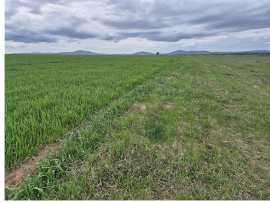
19-20. kép: A 10. kutatási terület É-ről DNy felé és D-ről É felé fotózva

A 11. számú terület a Seg-hegy területe és annak környéke, amely egy magaslaton található, főleg gyepes terület, így csak minimálisan volt kutatható. A legmagasabb pontján katonatemető található, a déli részén szántott és boronált, de igen köves-kavicsos parcella van, így ez a terület volt csak kutatható. Régészeti leletet, jelenséget nem találtam.