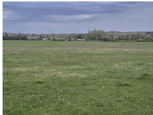
17-18. kép: A 9. kutatási terület Ny-ról ÉK felé és Ny-ról K felé fotózva

A 10. számú terület a Telek-hegy, amely egy észak-déli irányú magasan fekvő plató, és jelenleg bokáig érő búza és gyepterület fedeti, amely csak részben volt kutatható. Régészeti leletet, jelenséget nem találtam.