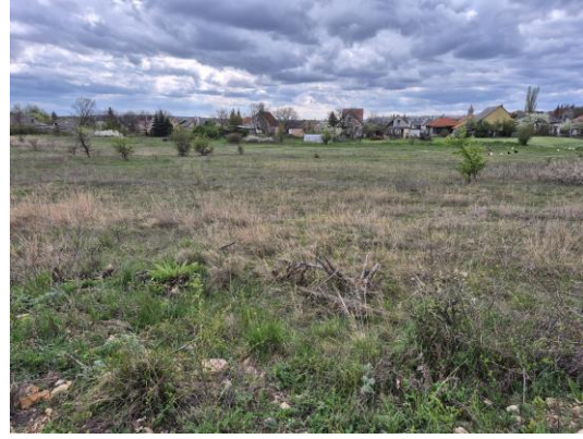
5-6. kép: Az 1. kutatási terület ÉK-ről DNy felé és K-ről Ny felé fotózva

A 2. kutatási terület a Lövőtér, amely egy domboldalnak a keleti része és jelenleg gyep fedí, így csak minimálisan volt kutatható. A mellette fekvő parcella szántott és boronált volt, így ez a terület volt csak kutatható. Régészeti leletet, jelenséget nem találtam.