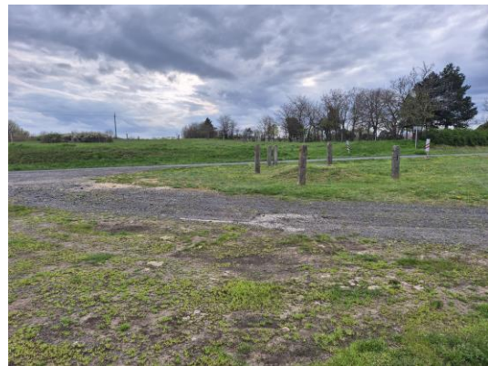
21-22. kép: A 11. kutatási terület É-ről DK felé és D-ről ÉNy felé fotózva