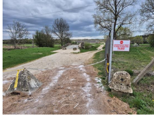
15-16. kép: A 7. kutatási terület É-ről D felé fotózva és a lezárás

A 9. számú terület a TSz major területe, amely a Séd bal oldali magaspártján fekszik, azonban a régi felszámolt vasútvonal és a gyepterület miatt csak minimálisan volt kutatható. Régészeti leletet, jelenséget nem találtam.