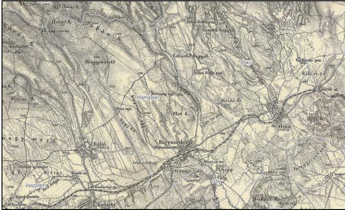
4. kép: „Hajmáskér”, azaz Hajmáskér a III. katonai felmérés térképszelvényein