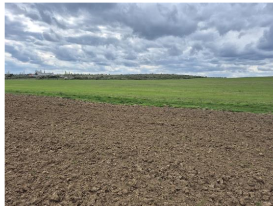
7-8. kép: A 2. kutatási terület DK-ről Ny felé és K-ről Ny felé fotózva

A 3. kutatási terület a Lövőtértől délkeletre fekvő terület, amelyet jelenleg gyep és kisebb fák fednek, körülötte beépített területek vannak, így csak minimálisan volt kutatható. Régészeti leletet, jelenséget nem találtam.