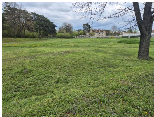
9. kép: A 3. kutatási terület É-ről DNy felé fotózva

A 4. kutatási terület belterületi rész, amely a település nyugati felén található, amely a templom környezetét és a Rákóczi utca 4. szám alatti telket is magában foglalja, amely beépített rész és a középkori település központja lehetett, amely egyébként is egy magaslaton található. A terület terepbejárással nem volt kutatható.