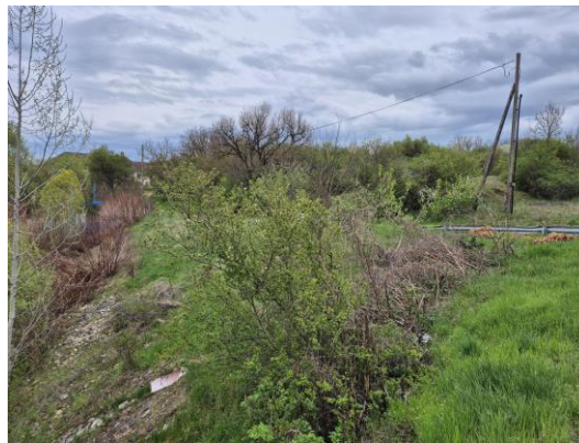
31. kép: A 14. régészeti lelőhely ÉNY-ről DK felé fotózva

A 14. számú terület a Bekötőút területe, amely egy fákkal benőtt, gyepes magaslatot, egy régi malmot és egy, a Séd-patakból leválasztott vízfolyást foglal magába, így csak minimálisan volt kutatható. Régészeti leletet, jelenséget nem találtam.