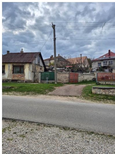
10-11. kép: A 4. kutatási terület Ny-ról K felé és DK-ről ÉNy felé fotózva

Az 5. kutatási terület egy T-alakú új út területe, amely egy mélyebben fekvő területen, elkerített, magántulajdonú részen található, és jelenleg gyeppel fedett, így csak minimálisan volt kutatható. A tőle, közvetlenül északra lévő terület szántott és boronált volt, így ez a terület volt csak kutatható. Régészeti leletet, jelenséget nem találtam.