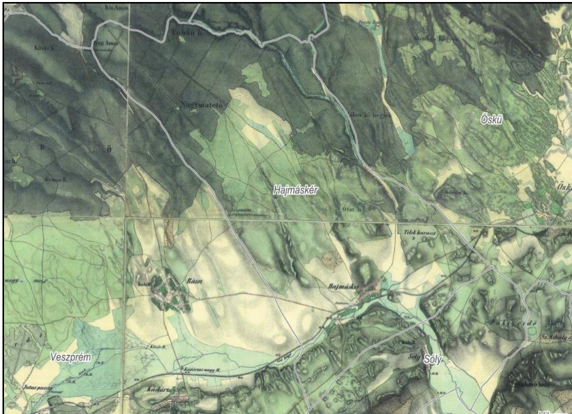
3. kép: „Hajmásker”, azaz Hajmáskér a II. katonai felmérés térképszelvényein

A II. katonai felmérés aktuális lapjait tanulmányozva elmondható, hogy a 19. századi lecsapolások és folyószabályozási munkálatok nyomán már a mai térszínhez hasonló domborzat és vízrendszer jelenik meg a térképlapokon. Ezen a felmérésen már jól kikövetkeztethetők a vizsgált területen és annak környezetében lévő vízmentesek területek, magaslatok. Ezek a vízmentes, de vízhez közeli magaslatok emberi megtelepedésre a történelem folyamán alkalmasnak bizonyultak (3. kép).