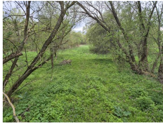
29-30. kép: A 13. kutatási terület DK-ről ÉNy felé és DK-ről ÉNy felé fotózva

A 14. számú terület a Bekötőút területe, amely egy fákkal benőtt, gyepes magaslatot, egy régi malmot és egy, a Séd-patakból leválasztott vízfolyást foglal magába, így csak minimálisan volt kutatható. Régészeti leletet, jelenséget nem találtam.