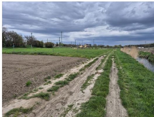
14. kép: A 6. kutatási terület Ny-ról K felé fotózva

A 6. kutatási terület a Séd-partja és a vasútállomás területe, amely a Séd bal partján található, ahol murvás út, megművelt kiskertek és épületek találhatóak, így részben volt kutatható. Régészeti leletet, jelenséget nem találtam.