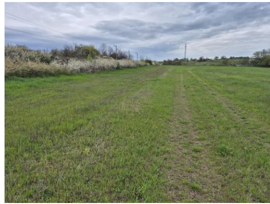
25-26. kép: A 12. kutatási terület ÉK-ről DNy felé és É-ről K felé fotózva